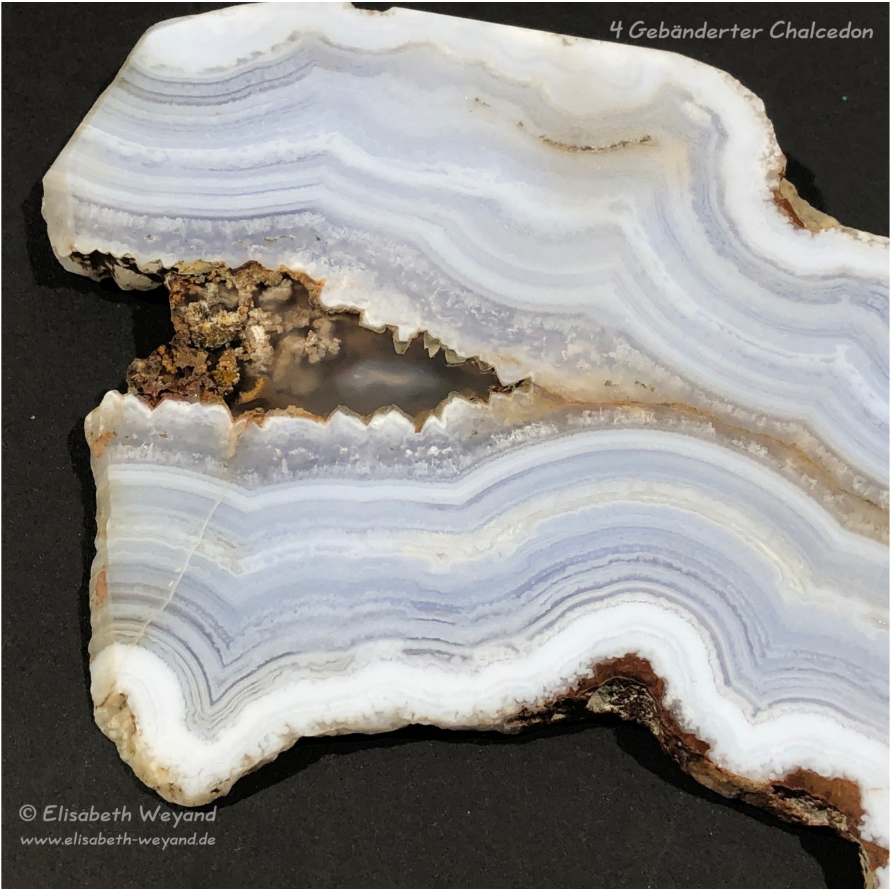
4 Gebänderter Chalcedon